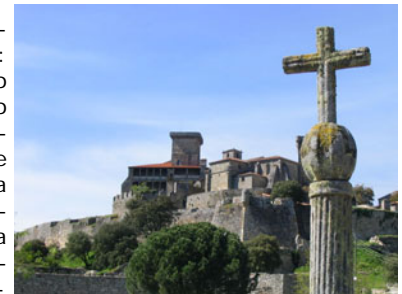
Detalle de Monterrey, cruceiro y Fozleza (Provincia de Ourense)

Pero entonces se hace inevitable la pregunta de Pilato: ¿Qué es la verdad? Y ¿cómo se la reconoce? Si para esto se remite a la "razón pública", como hace Rawls, se plantea necesariamente otra pregunta: ¿qué es razonable? ¿Cómo demuestra una razón que es razón verdadera? En cualquier caso, según eso, resulta evidente que, en la búsqueda del derecho de la libertad, de la verdad de la justa convivencia,